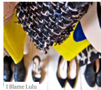
I Blame Lulu