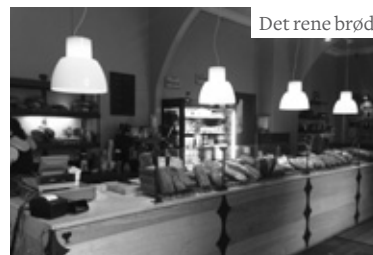
Det rene brød