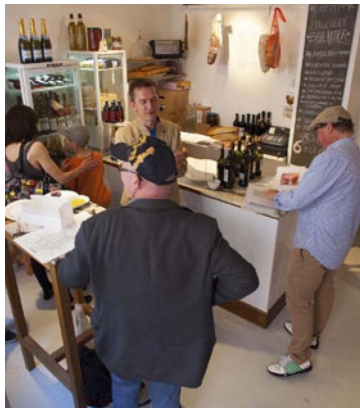
Sfuso &amp; Cicchetti