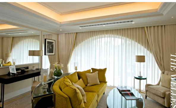
THE WELLESLEY HOTEL LONDON