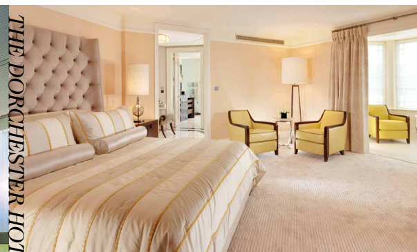
THE DORCHESTER HOTEL